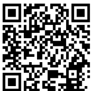
What'sApp secteur LFA

Vous pouvez vous abonner à la chaîne WhatsApp du secteur et à la chaîne WhatsApp du groupement de Mennecy pour recevoir les informations entre 2 éditions du Parvis. Les liens des chaînes sont disponibles sur la page d'accueil du site internet du secteur : secteur-lafertealais.fr ou vous pouvez scanner les QR code ci-dessous :